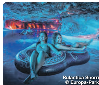
Rulantica Snorri