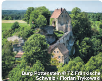
Burg Pottenstein

Alle Termine und Angaben unter Vorbehalt!