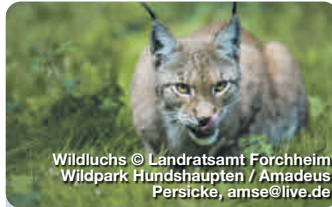
Wildluks

Im Jahr 2011 konnte das umgestaltete Höhenschwimmbad wiedereröffnet werden. Es wurde ein Naturbad geplant, das ohne Chlor, allein durch Pflanzen und Kies geklärt wird. Ohne Eintritt ist das Naturschwimmbad nun Treffpunkt für Jung und Alt. Schützenstraße 1, Gößweinstein