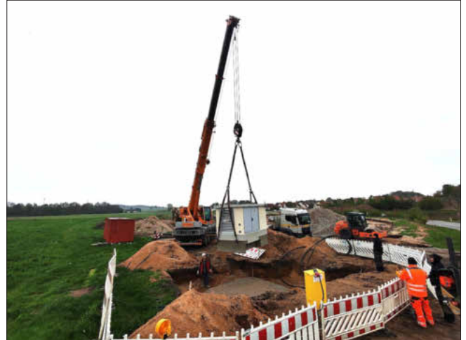
Liefern und Setzen der Trafostation